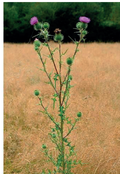
Le cirse vulgaire