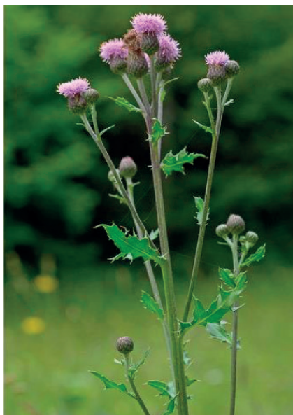
Le chardon des champs

Trois chardons et cirses sont considérés comme problématiques car leur prolifération représente un risque de contamination des parcelles agricoles, préjudiciable économiquement pour les agriculteurs (gêne, dégradation ou perte de récolte). A ce titre, ces plantes indésirables sont soumises à obligation de lutte sur le territoire cantonal selon le Règlement sur la protection des végétaux du 15.12.10 :