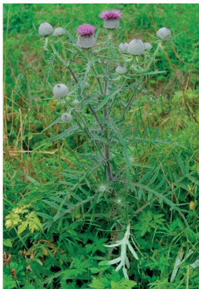
Le cirse laineux