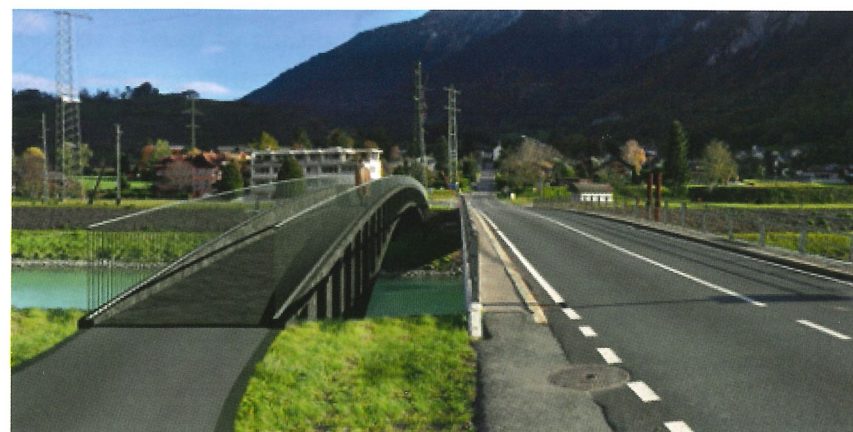
Projet de passerelle le long du pont du canal de fuite

• La création d'un trottoir à la Route du Stand (ce projet est déjà à l'enquête publique et sera réalisé en 2021).