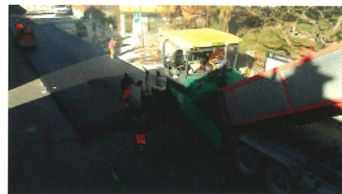
La Rue Centrale en octobre dernier